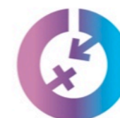
COMUNE DI SCHIO Commissione Comunale per le Pari Opportunità