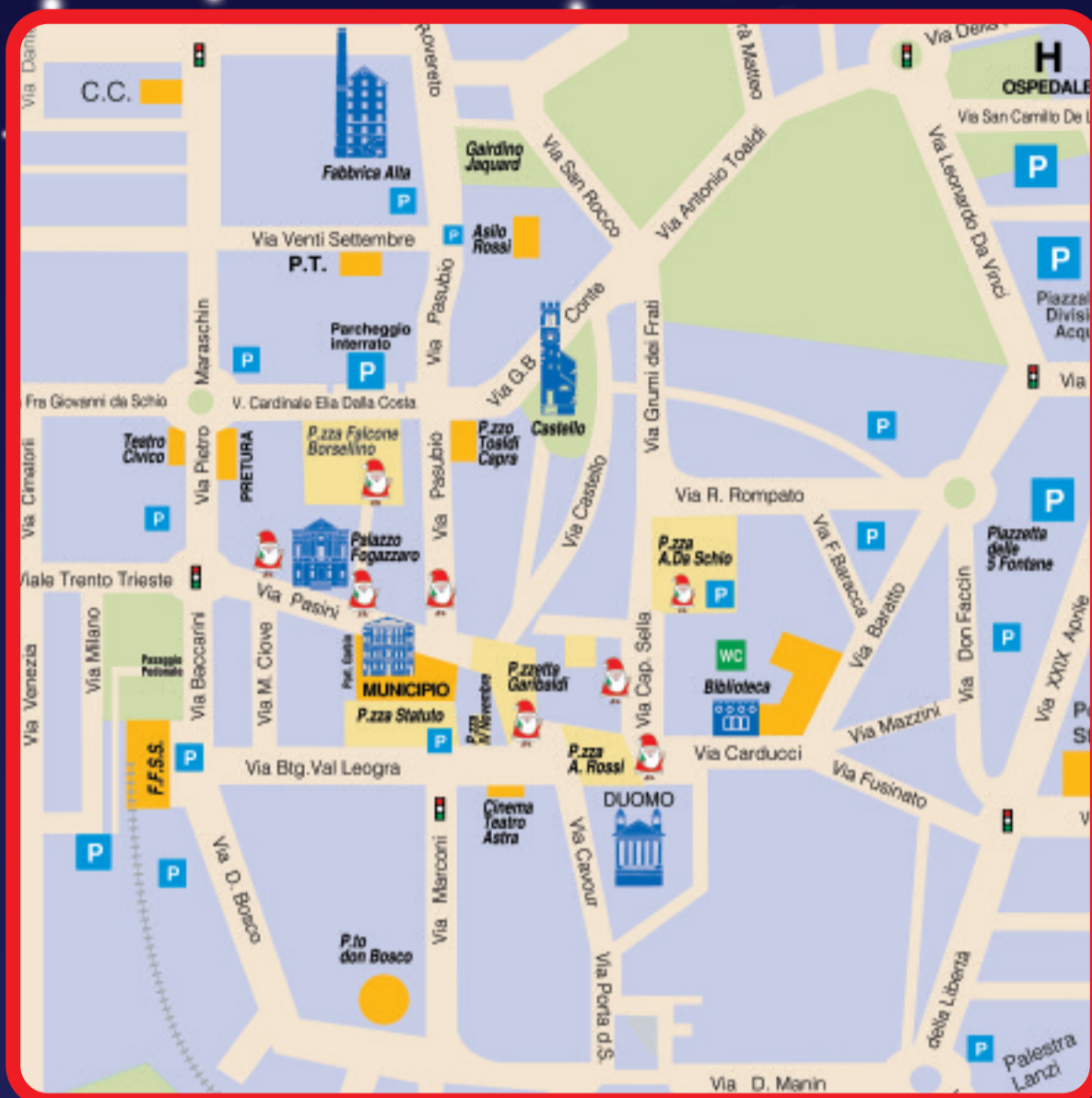
Studio Matino e Boschetti

Mercatino di Natale : in piazza Rossi 8-9-10; 16-17; 23-24 dicembre. Tante proposte e simpatiche idee