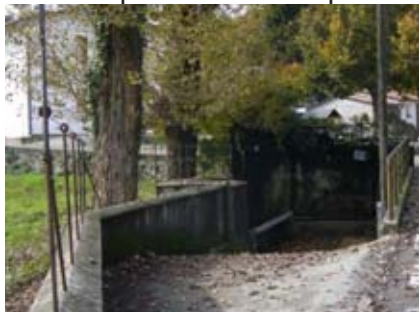
Lavatoio in Contrà Poletti

A sinistra della strada di contrà Poletti si vede un'antica fontana sulla cui parete c'è un capitello alla Regina del S. Rosario (1984).