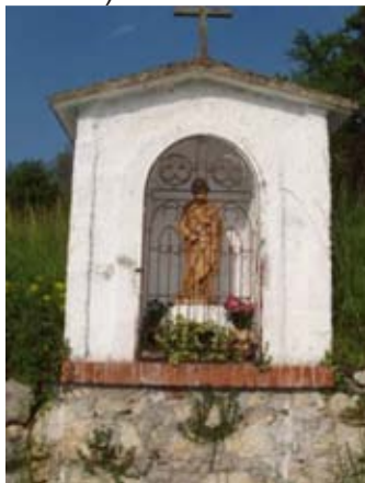
Capitello con statua lignea di S. Pietro

Si gira a sinistra e, dopo altri 300 m, si svolta nuovamente a sinistra per una strada sterrata in leggera discesa. In breve tempo si raggiunge contrà Corièle, antica ed interessante sia per l'architettura delle case, sia per il pregevole forno ed il capitello dedicato a Sant'Antonio da Padova.