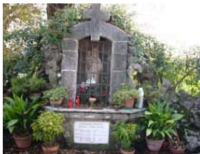
Capitello alla Regina del S. Rosario

Si riprende il cammino sulla breve rampa e dopo un po' si arriva ad un crocicchio di sentieri: il primo a sinistra conduce al Tiròndolo e Vallugana, quello diritto ai Ceòla e Montepian, quello a de-