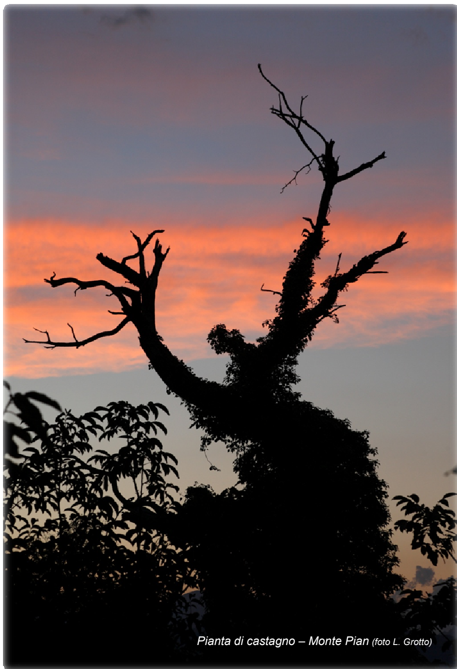
Pianta di castagno – Monte Pian