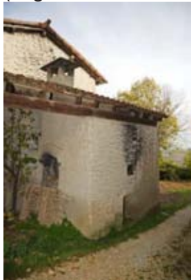
Forno in Contrà Corièle