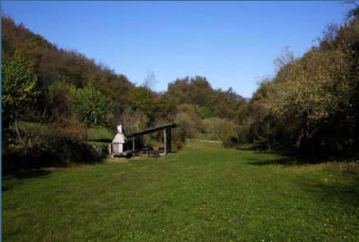
Area attrezzata nella Bassa dei Ceòla

Il termine anguane si riferisce alle dee della acqua (ninfe della mitologia greco-romana).