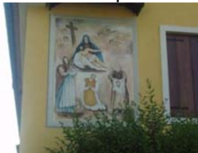
Affresco della Pietà con santi

Partendo dalla piazza Gen. Valerio Bassetto, si segue via San Tomio, costeggiando la Villa Checcozzi/Carli/Dalle Rive e poi l'area archeologica della Villa rustica romana. Al bivio, si gira a destra lungo via Loghetto dove sono stati ritrovati reperti di culti precristiani. A 50 m, a sinistra, sulla facciata della ex-latteria sociale si nota la nicchia di S. Antonio da Padova, quindi si procede dritto per 200 m e qui, sulla parete ovest di un'abitazione, si vede un affresco della Pietà con Santi del sec. XIX, restaurato recentemente (1996); si gira a sinistra per raggiungere in breve contrà Poletti. Passando da via San Tomio a via Loghetto, si nota un cambiamento nel paesaggio: da prettamente urbano a rurale, caratterizzato da prati inframmezzati da filari di salici ( Salix spp.), tagliati a capitozza 7 .