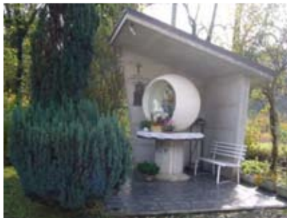
Capitello a S. Maria Liberatrice

giungere il ponticello sul dosso, ove sorge il capitello dedicato a S. Maria Liberatrice.