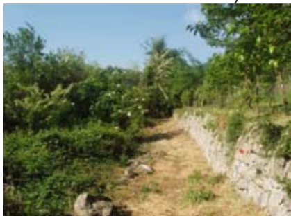
Il sentiero lungo il Promoldo

Si procede a sinistra, verso contrà Marchiori, e, alla curva che porta alla contrada vera e propria, si svolta a sinistra lungo un alto muro verso il Promoldo (una dorsale che per la sua forma è chiamata anche el cavàlo ).