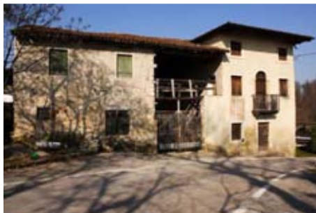
Costruzione del 1726

Il sentiero riprende a salire leggermente e dopo un po' ritorna sulla strada asfaltata lasciata poco prima. Si svolta a sinistra e da qui si può ammirare una graziosa costruzione settecentesca con ballatoio e scala in legno. Sulla parete orientale, tra due finestre, è presente un affresco della Sacra Famiglia, bisogno di un serio recupero.