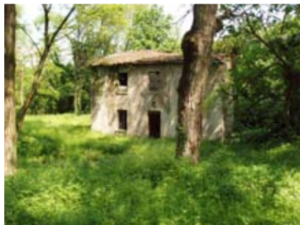
Casa Sartori, tra Zucchèo e De Munari

Ultimata la ripida e breve discesa, si raggiunge il sentiero proveniente da contrà Lappi, si svolta a destra e, in direzione est, si percorre un bel tratto costeggiato da un muretto ben conservato fino all'altezza dei ruderi di una vecchia abitazione.