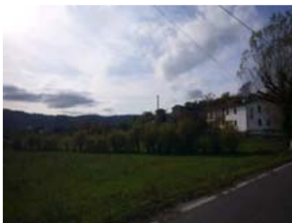
Panorama lungo via Loghetto

Si procede quindi sulla strada che si inerpicca a sinistra e dopo circa 200 m si scorge, sulla destra, un affresco dedicato alla Sacra Famiglia, rifatto nel 2000 su uno precedente del 1843.