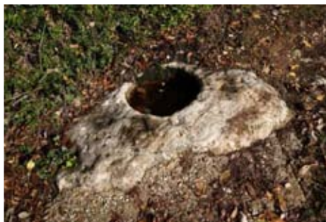
Buca per pestare le foglie di tabacco

per altri 300 m attraverso una radura che ci immette in un tratto ripido boscoso, lungo una valletta di scolo per l'acqua.