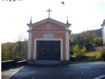
Chiesetta dell'Immacolata

Superato un piccolo ruscello, si raggiunge la vecchia contrada, dove, nel 1945, è stato edificato un bel Sacello a S. Giuseppe.