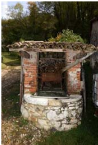
Il pozzo di Contrà Lappi

ta, è visibile un bell'affresco devozionale di Maria Bambina (che riproduce un altro affresco sul muro interno); dopo 100 m ci si imbatte nel capitello di contrà Lappi, dedicato alla Madonna delle Grazie, eretto per riconoscenza agli scampati pericoli durante il secondo conflitto mondiale.