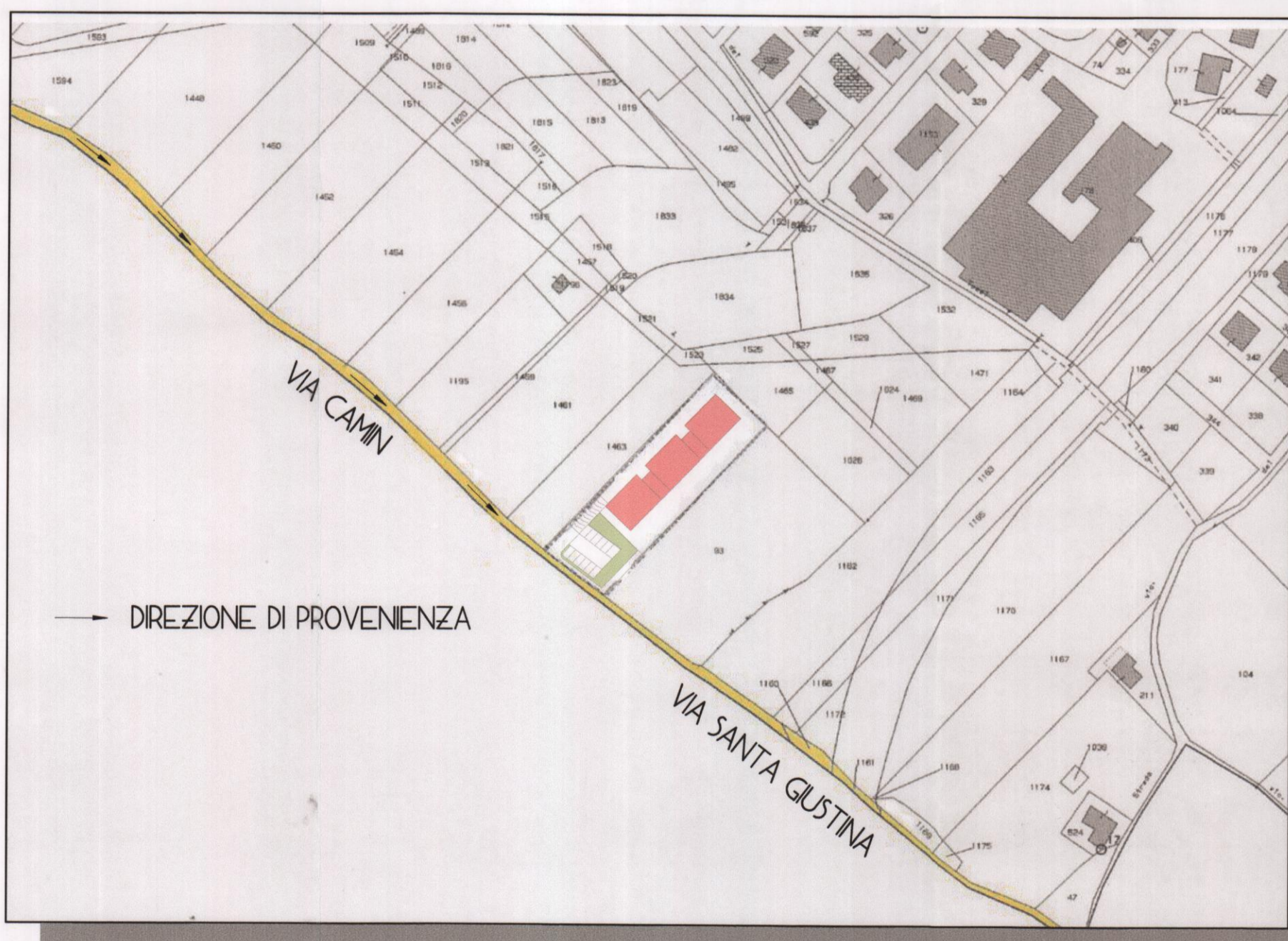
ESTRATTO CATASTALE - PROGETTO CON VIABILITA' COMUNE DI SCHIO-MAGRE' - FG 3* - mapp n° 523

ELABORATO IDENTIFICATO AL SUB A1 D.G. 374 del 26/11/2013 di adozione COMUNE DI SCHIO IL RESPONSABILE P.O. Luca Strazzabosco